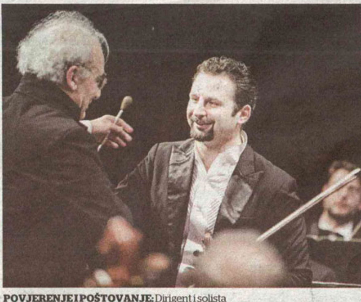
POVJERENJE I POŠTOVANJE: Dirigent i solista

-Ja sam u Crnoj Gori više od pet godina i za mene je velika avantura da posmatram kako mladi zdravi Crnogorci pola dana sjede u kafici i ispijaju kafu sa vodom i cigaretom! Socijalizuju se. A, kada oni rade? Od čega žive njihove porodice? Još se nisam usudio da ih to pitam.