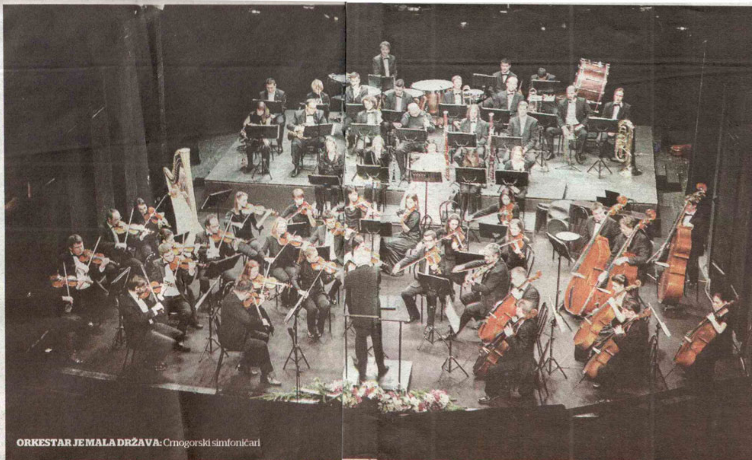
ORKESTAR JE MALA DRŽAVA: Crnogorski simfoničari

-Volim sve vrste muzike različitih epoha i stilova, pod jednim